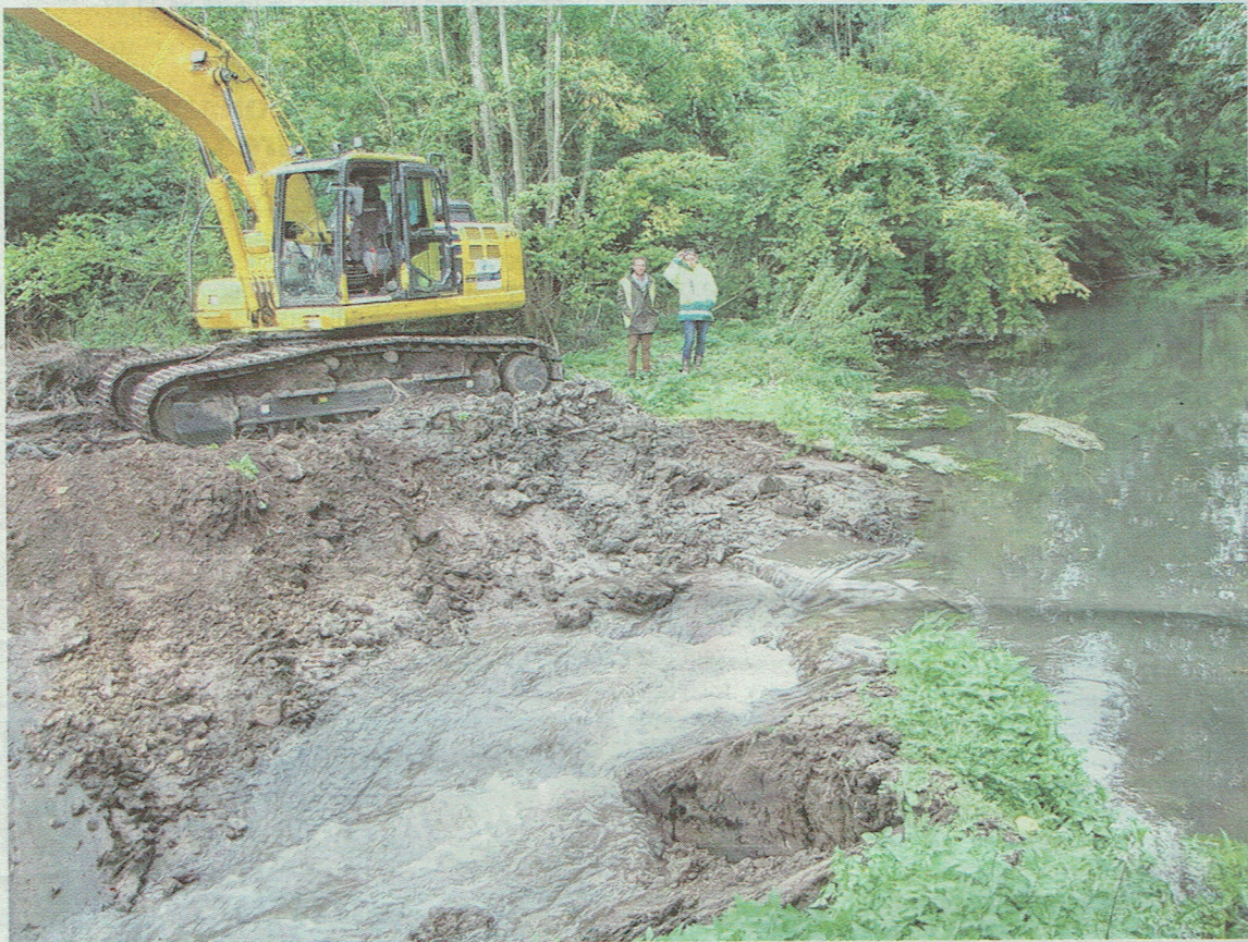
La mise en eau du nouveau lit s'est faite progressivement au cours de l'après-midi.

Elle ne passe plus par le moulin de Sailleville, infranchissable par les poissons et les sédiments.