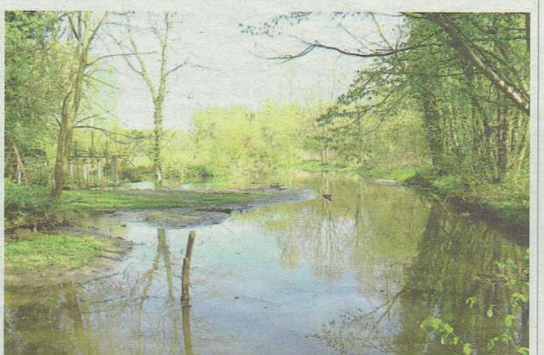
Le système de vannes et de turbines ne fonctionne plus au moulin de Sailleville. Si bien que la rivière s'est élargie.