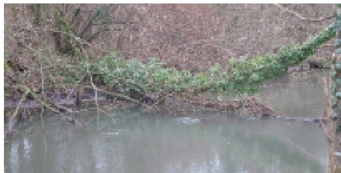
Embâcle présent sur la Brèche avant entretien

En parallèle de ces travaux d'entretien, des petites actions de restauration sont prévues. Il s'agit de la mise en place de déflecteurs rustiques et du déconcrétionnement de micro seuils calcaires. Enfin, les déchets présents en berge sont enlevés et déposés en déchetterie.