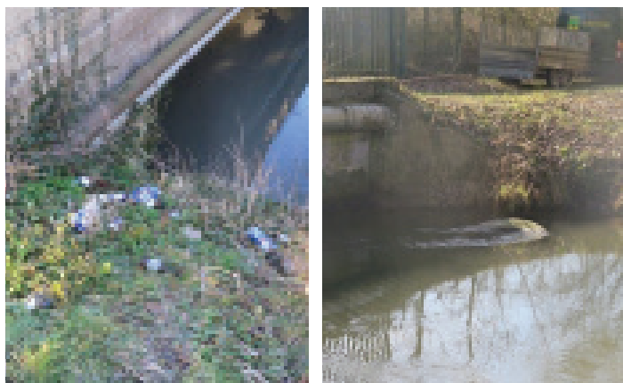
Retrait des déchets en berge

La section de la Brèche concernée par la tranche 2019 débute dans la zone d'activité Saint Gobain Isover à Rantigny et se termine à la confluence entre la Brèche et l'Oise (commune Villers Saint-Paul) soit 10,8 km de cours d'eau sur les communes de Rantigny, Laigneville, Breuil-le-Vert, Nogent-sur-Oise, Monchy-St-Eloi, Liancourt, Mogneville et Villers-St-Paul.