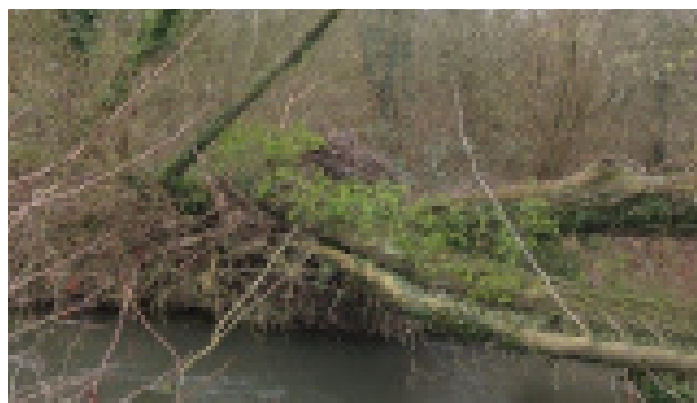
Embâcle présent sur la Brèche avant entretien