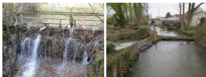
Seuil du moulin d'Aneuze

Plus d'infos sur notre site : www.smbvbreche.fr