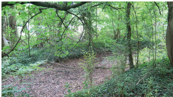
Méandre à remettre en eau

En parallèle, le syndicat a lancé des études d'aménagement sur 5 moulins (4 sur Agnetz et 1 sur Laigneville) et va travailler sur une programmation pluriannuelle à l'échelle du bassin. L'objectif est de proposer plusieurs programmations aux élus à la fin de l'année 2018, pour lancer ensuite les procédures administratives en 2019.