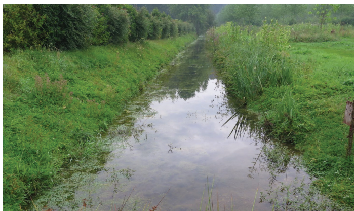
Affluent de l'Arré à Airion

En 2018, le SMBVB a prévu de réaliser des travaux de restauration sur un affluent de l'Arré, au niveau de la commune d'Airion. Il interviendra également sur la Brèche sur le secteur de Monchy Saint Eloi et de Nogent sur Oise, afin de remettre en eau d'anciens méandres actuellement déconnectés et de restaurer la continuité écologique au niveau d'un pont. Enfin, si les conditions sont réunies, des travaux de restauration de la continuité écologique à Clermont et Fitz-James seront mis en œuvre.